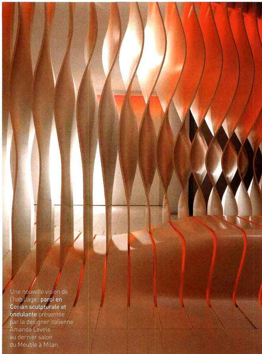
Une nouvelle vision de l'habillage : paroi en Corian sculpturale et ondulante présentée par la designer italienne Amanda Levete au dernier salon du Meuble à Milan.